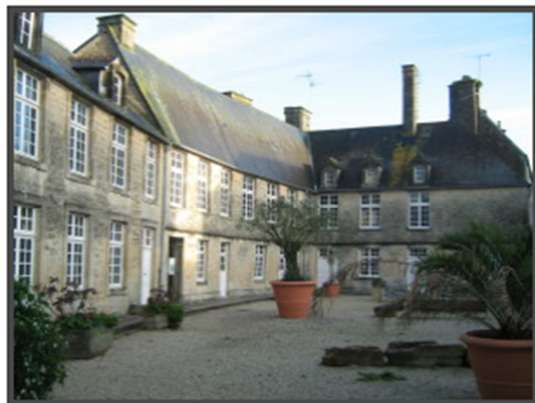
Hôtel de Thiboutot (16 e – 19 e ) ou