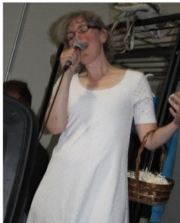
"I went to the market"... Mon p'tit panier sous mon bras...