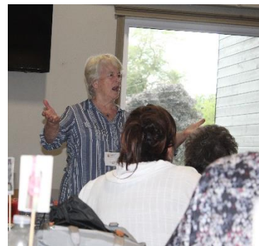
....La La La Lalala...