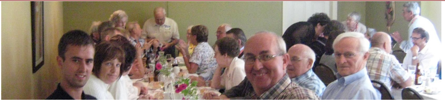
Saint-Jean-Port-Joli, 3 e rassemblement, 31 juillet 2010