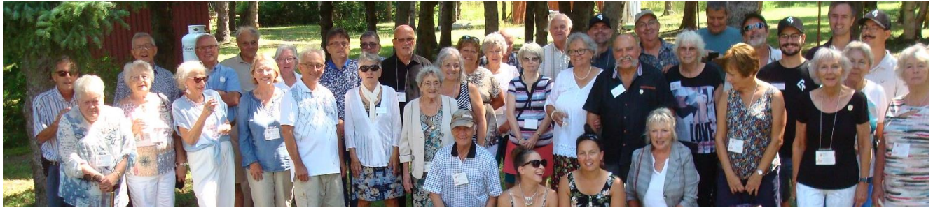
Rivière-Ouelle, Camp Canawish, 7 e rassemblement, 20 août 2022