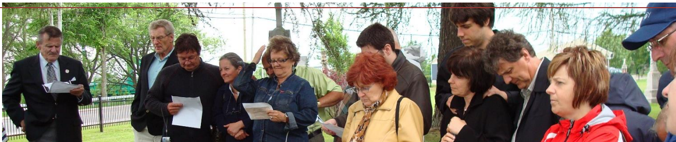
Rivière-Ouelle, 2 e AGA, 20 juin 2009