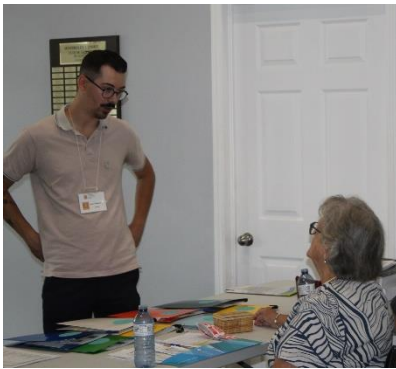
On arrive tôt et...