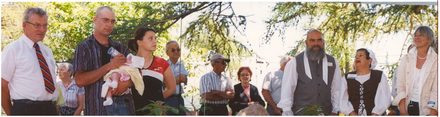
Rivière-Ouelle, 1 ère rencontre 2006