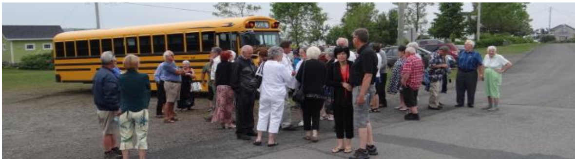
Rivière-Ouelle, 7e rassemblement 30 juin 2018. Au quai de Rivière-Ouelle, "y fait fret !"