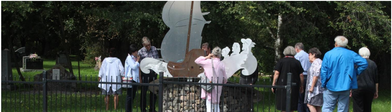
Rivière-Ouelle, 13 e AGA, 26 août 2023