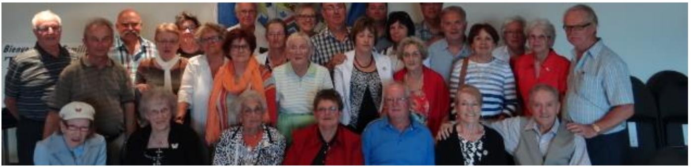
Montmagny, 5 e AGA, 20 juin 2015