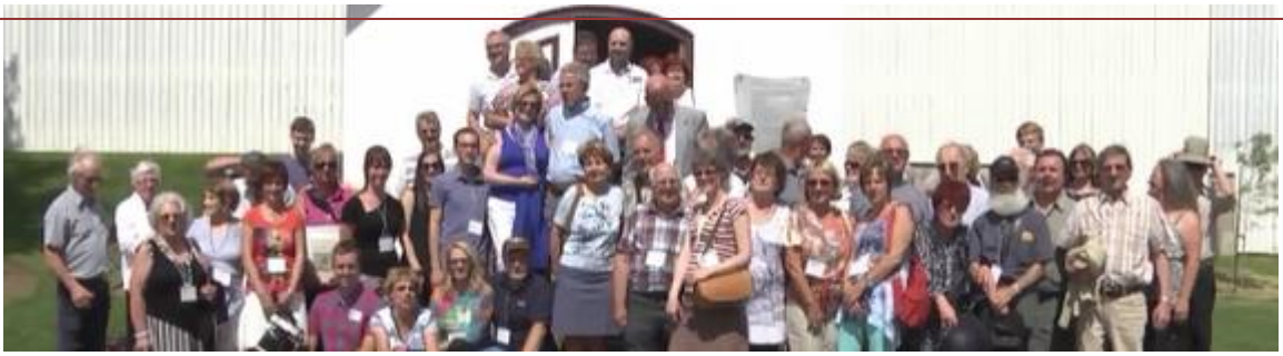
Saint-Raymond, 5e rassemblement , 28 juin 2014