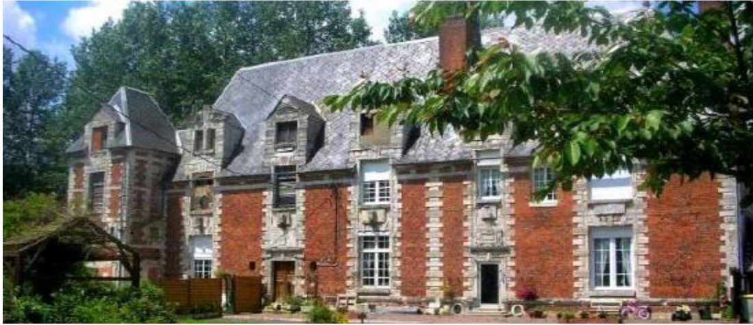
Manoir de la La Pailleterie