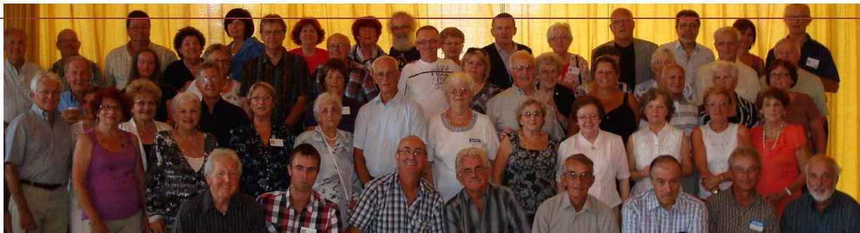
Lévis, 3e rassemblement 13 août 2011