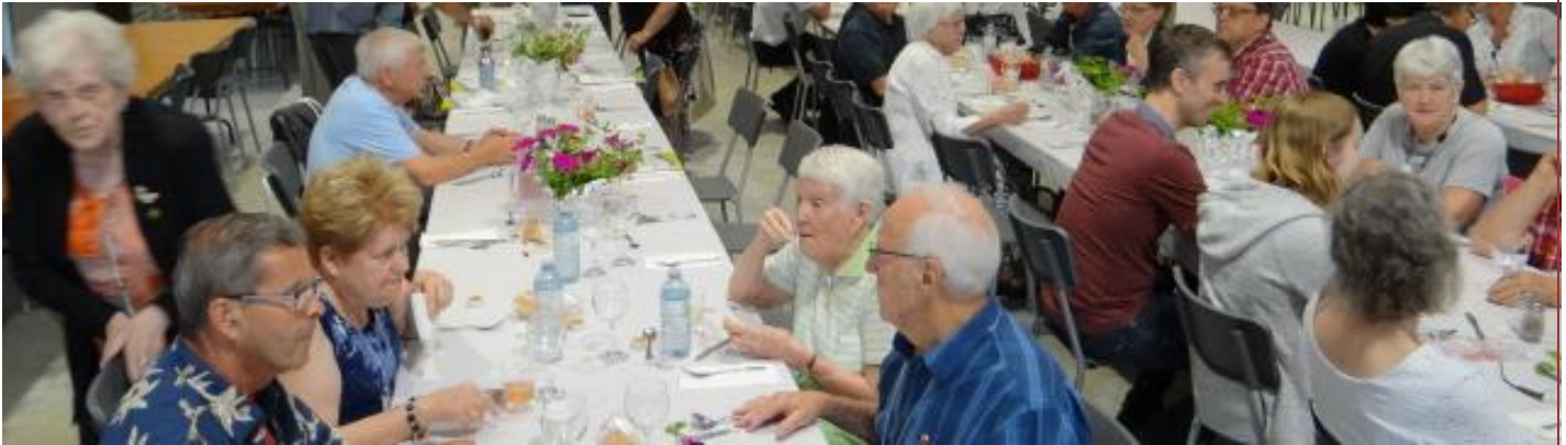
Rivière-Ouelle, 26 août 2018