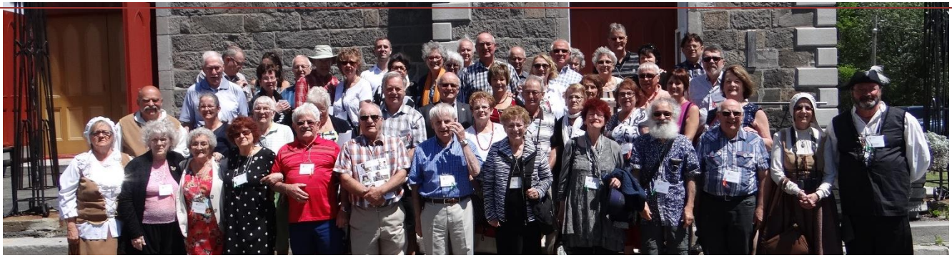
Saint-Roch-des-Aulnaies, 6e rassemblement 18 juin 2016